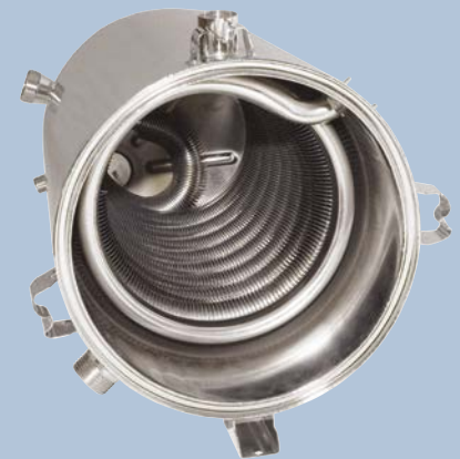
Corps de chauffe conique breveté inox plus performant