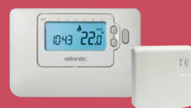
NAVILINK H58 Réf. 074 207