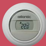
NAVILINK H15 Réf. 074 205