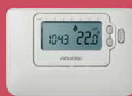
NAVILINK H55 Réf. 074 206